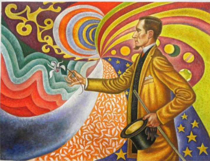
Portrait de Félix Fénéon , huile sur toile (1890), Museum of Modern Art (New York) .Tableau de Paul Signac .