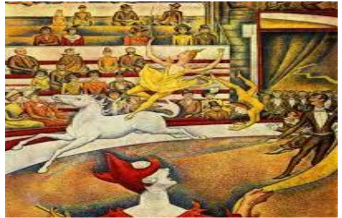
Le Cirque est un tableau de Georges Seurat peint en 1890 et actuellement exposé au musée d'Orsay. Il représente le numéro de l'écuyère du cirque Fernando.