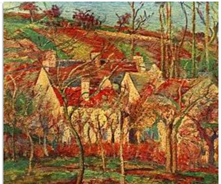
Toits rouges , coin d'un village, hiver, 1877 (Côte de Saint-Denis, Pontoise), Paris, musée d'Orsay. Tableau de Camille Pissarro .