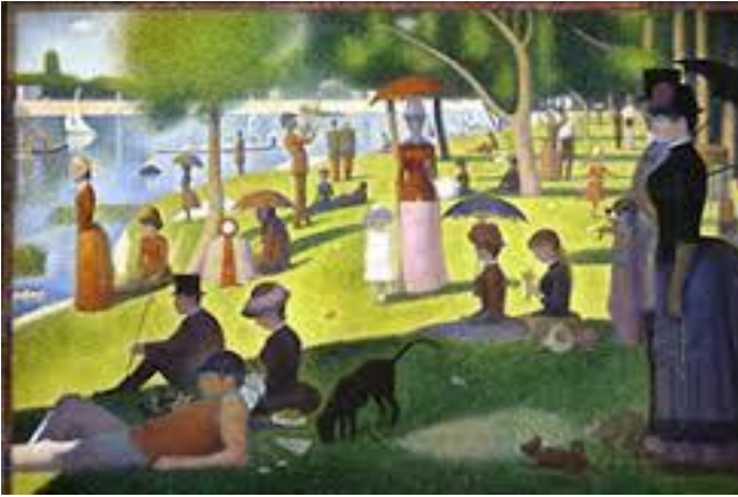
Un dimanche après-midi à l'île de la Grande Jatte est un tableau de Georges Seurat , exposé à l'Art Institute of Chicago.

Voici quelques artistes connus ayant utilisé le pointillisme.